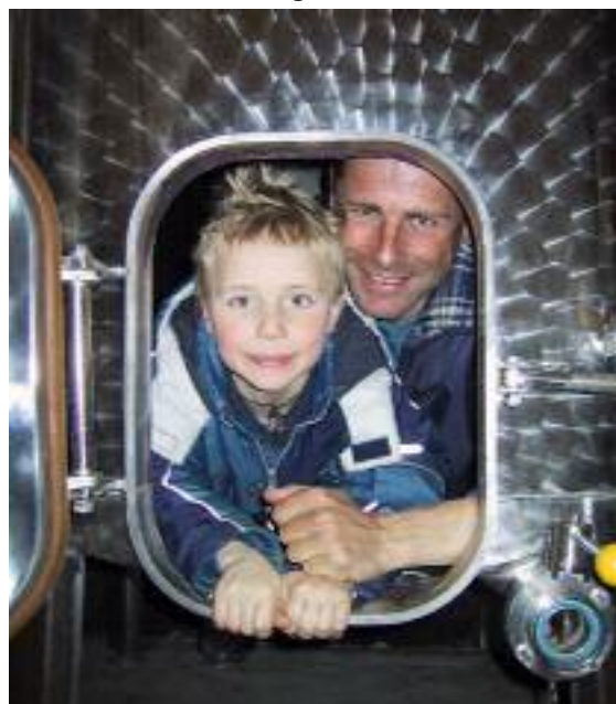
Der Junior und der Profi haben gut Lachen

Die Weissweine des neuen Jahrgangs sind ebenfalls sehr spannend. Sie sind eine Spur leichter im Trinkgenuss und etwas schlanker als die 2000er. Dafür sind sie mit um so mehr Frische und Finessen ausgestattet und sortentypischer als ihre Vorgänger. Da kann der Sommer so richtig heiss werden!